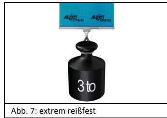
Abb. 7: extrem reißfest