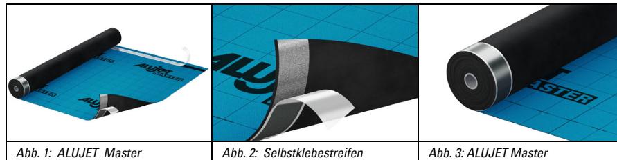
Abb. 1: ALUJET Master

Die ALUJET Master ist eine diffusionsoffene Unterdeck- und Unterspannbahn. Der 4-lagige Polypropylen Vlies- und Folienverbund aus UV-stabilisierten Spezial-Polyolefin Vliesen erfüllt die Anforderungen der CE EN 13859-1, CE EN 13859-2 und den neuesten ZVDH-Richtlinien.